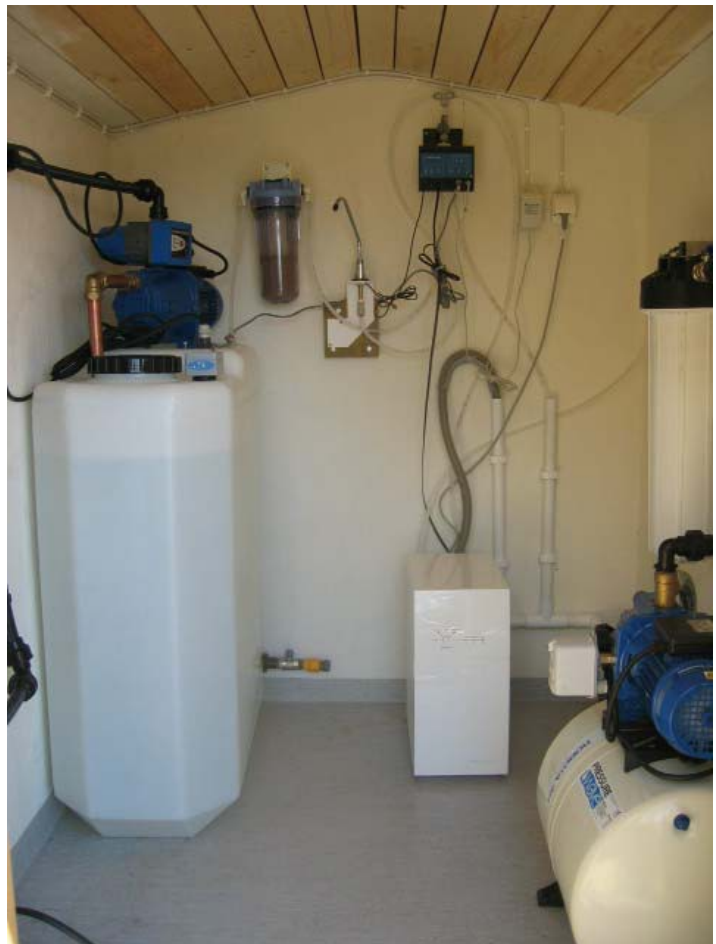
Exempel på installation i ett pumphus för rening av Östersjövatten till ett hushåll med en 280 liter uppehållstank.

Vattenrenaren Confidence RO400 Light är framtagen för bräckt vatten eller relict vatten. En odrinkbar blandning av havets salta vatten och grundvattnets källor. Ett besvärligt problem. I Sverige har vi det även i Östersjön. Stora, komplicerade och krångliga reningsanläggningar var länge den ända lösningen för att bli av med så hög salthalt. Men inte längre. Confidence RO400 Light är ett litet och effektivt reningssystem som förvandlar bräckt vatten till rent och friskt hushålls och dricksvatten. Den producerar i så riklig mängd att den kan användas i alla slags ändamål, såsom dusch och tvätt. Hur stor reningsanläggningen skall vara bestämmer du själv. Renaren kopplas ihop med uppehållstanken från 180 liter och uppåt eller flera mindre. Renaren producerar med ca 2,5 lit/min rent vatten till uppehållstank och fyller automatiskt på vid behov. Du får som du vill – och framför allt, så får du absolut rent och säkert vatten tack vare kontinuerlig mätning och kontroll av vattenkvaliteten.